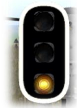
Luz naranja intermitente

Ordena al Maquinista, ponerse en condiciones de parar ante la señal siguiente o final de vía, en este caso situados a corta distancia.