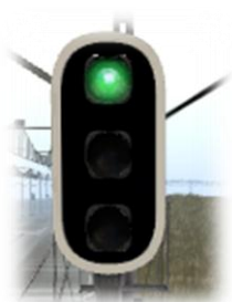
Luz verde intermitente

Ordena al maquinista no exceder de 160 km/h al paso por la siguiente señal salvo que esta muestre indicación de vía libre.